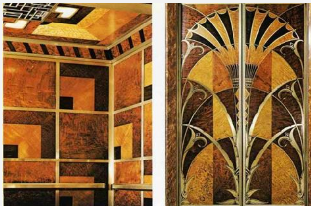
William Van Alen, The Chrysler Building (elevador - interior e porta), Manhattan, New York, 1930

Dada a curiosidade dos presentes e a abrangência das áreas criativas a tratar, não foi possível completar o tema proposto, o que acontecerá em Dezembro.